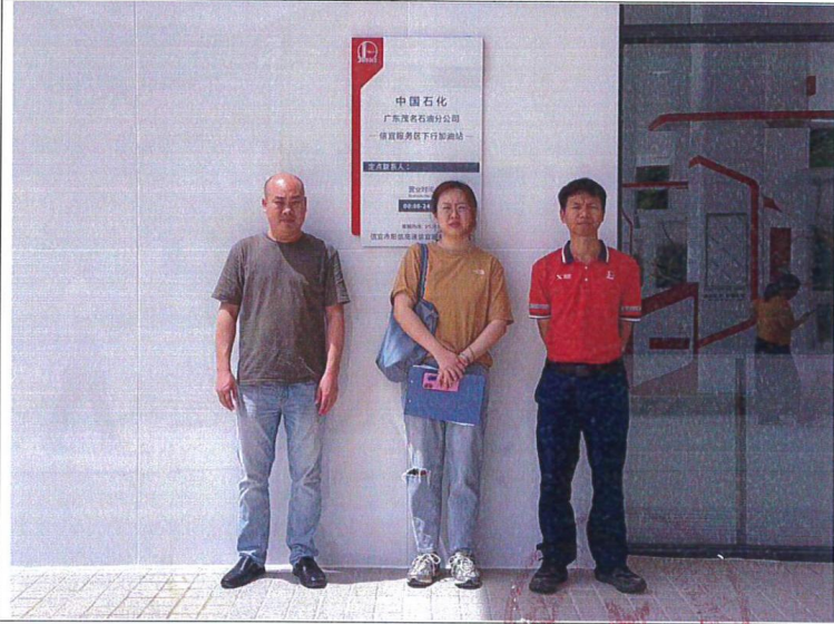
评价公司人员与油站负责人合照