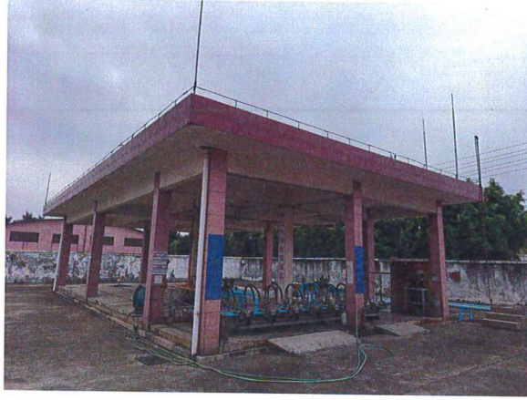
液化石油气储罐区