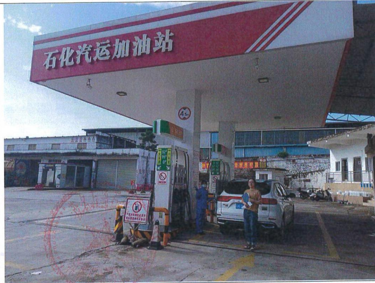
评价公司人员与油站负责人合照