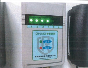
油罐在线渗漏监测系统