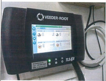
双层管在线渗漏监测系统