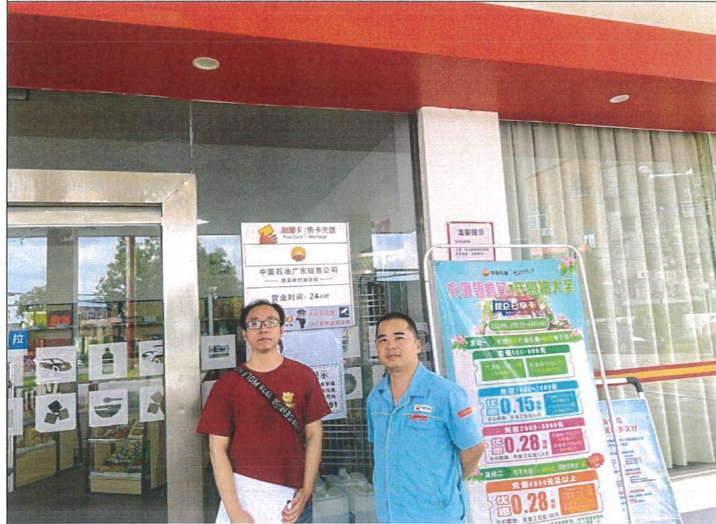
评价公司人员与油站人员合照