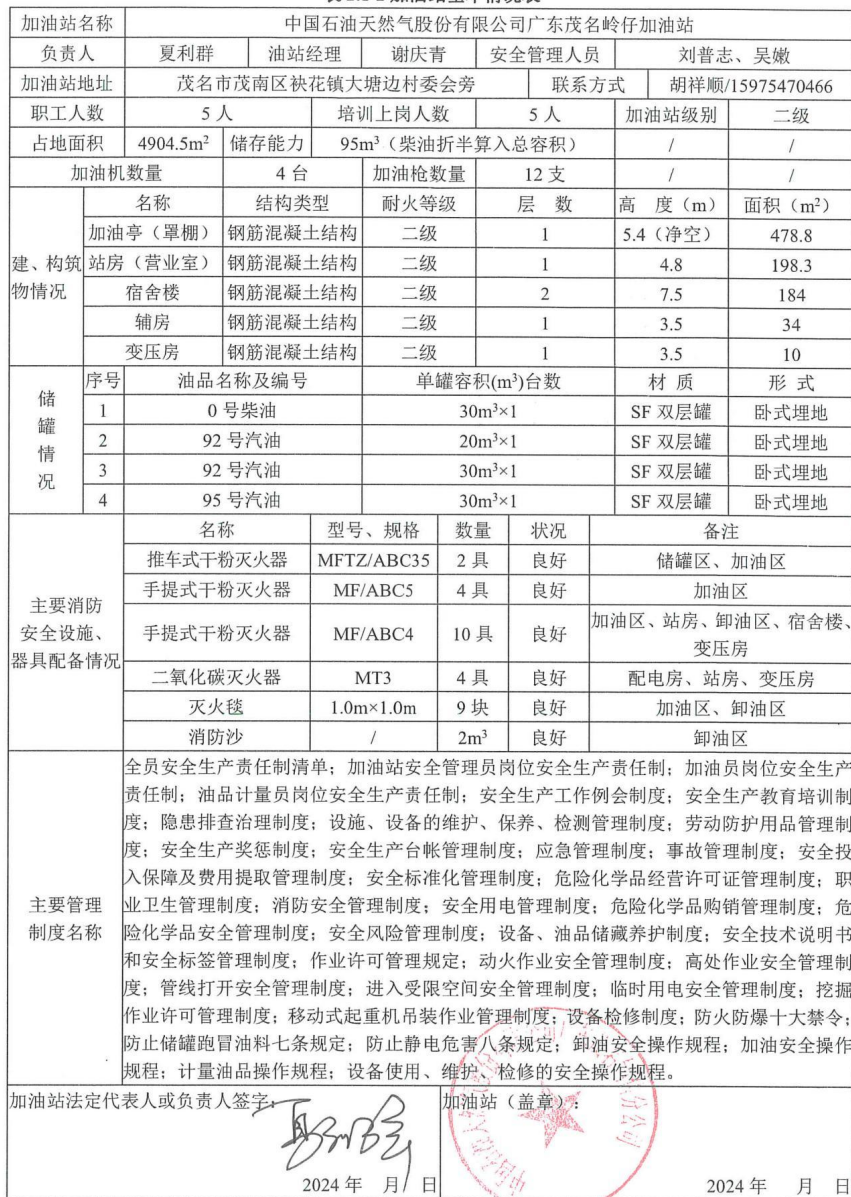
表 2.1-2 加油站基本情况表