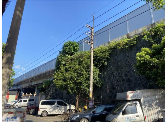
沈海高速广州支线