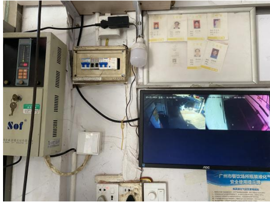
报警器总成及监控显示屏