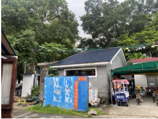
院落大门及卫生间