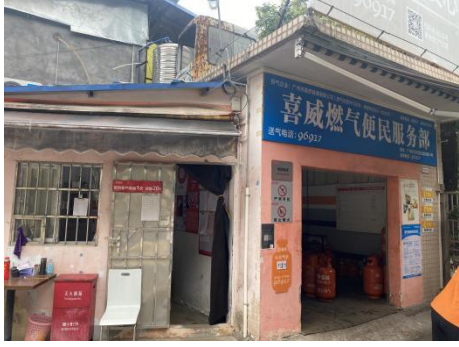
燃气便民服务部外观