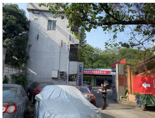
南面鸿运汽车维修