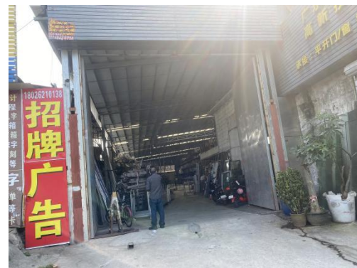
东面广铝五金厂房