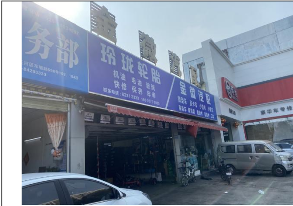
南面汽车修理厂（金微汽配）