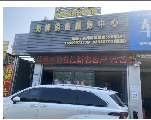
北面商铺（广铝光骏销售中心）